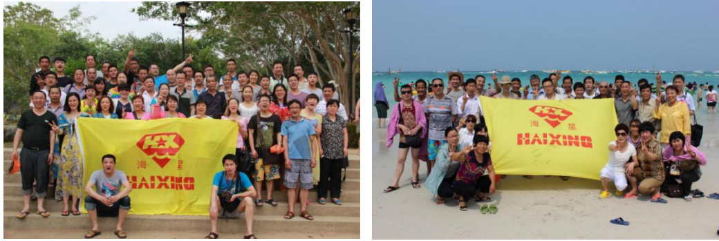
图表6.1-1 员工旅游案例